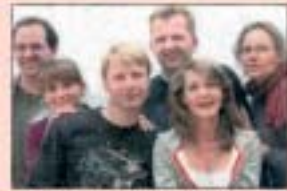
Die Profisten spielen im Kulturhaus.