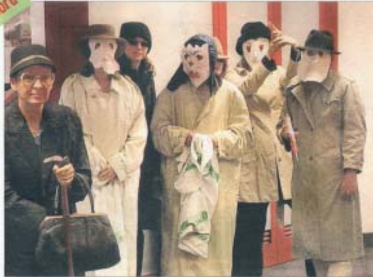
Theater „allusion“ präsentiert sich im Goldbekhaus.

Ein Thema, viele kreative Ideen: Eine offene Ausschreibung lud Theatergruppen, Künstler und Kulturinstitutionen ein, ihre Ideen zu diesem Thema zu schicken. 13 von den eingereichten Projektvorschlägen werden nun umgesetzt.