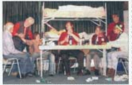
Die Theatergruppe zeigt auf der Bühne wie der Alltag von Obdachlosen aussehen kann.

voller zuerst die Arbeit, dann die Wohnung. Jede betrachtet die Welt lieber durch sein Fernglas. Insofern, der Schauspiel, hat schon seit Jahren kein Engagement mehr. Und Pause ist Profit im Betteln.