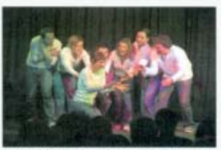
Die Theatergruppe „Dünnes Eis“ wird in der Nikolauskirche zum Thema „Geld oder Leben“ improvisieren.

schon mal schnell an der Waffelwerk es sein muss: Geld oder Leben eben. Das Publikum greift ein, mischt mit und bestimmt von feinen Plätzen aus die Szenen. Die Spieler auf der Bühne schüttern über Eis und keiner weiß wie es endet. Das Stück ist im Rahmen des Theaterfestivals: „GELD ODER LEBEN“ zu sehen, welches ein bezirkweites Theaterfestival in Hamburg Nord ist. Geld oder Leben fragt nach dem Wert von Geld oder Leben in der Gesellschaft und für jeden Einzelnen. Das Thema wird von den unterschiedlichen teilnehmenden Theatergruppen in Krimi oder Tragödie, Impro-Theater oder Komödie umgesetzt. Die zweite Spielzeit begann am 17. Januar, weitere Veranstaltungen sind bis zum 28. März zu sehen. Weitere Informationen zu Programmen und Spielorten unter www.geldoderleben.info . Karten zur Aufführung in der Nikolauskirche erhalten Interessierte zu 7 Euro/ 5 Euro unter Telefon 48 15 48 im Vorverkauf.