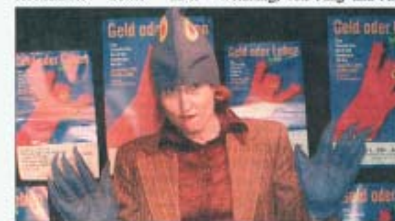
Was passiert, wenn ein Top-Manager plötzlich selbst zum Arbeitslosen wird und in einem Vermittlungs- und Trainingszentrum auf ein Dutzend weiterer ehemaliger Top Dogs stößt?